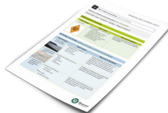
Template Werkinstructie gratis verkrijgbaar